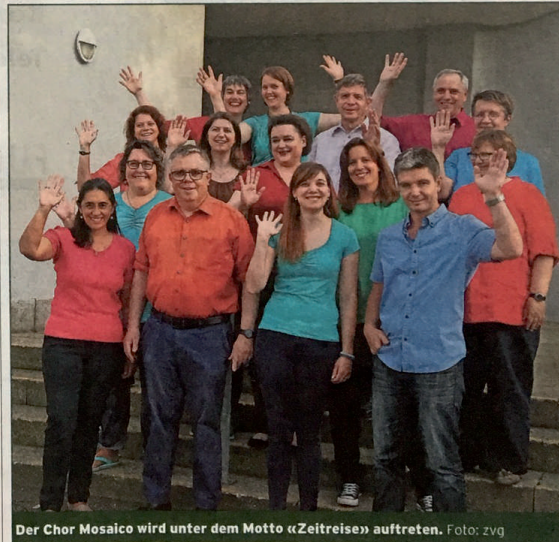
Der Chor Mosaico wird unter dem Motto «Zeitreise» auftreten.

Das Konzert beginnt um 17 Uhr in der katholischen Kirche Regensburg. Der Eintritt ist frei, es wird eine Kollekte erhoben. (e)